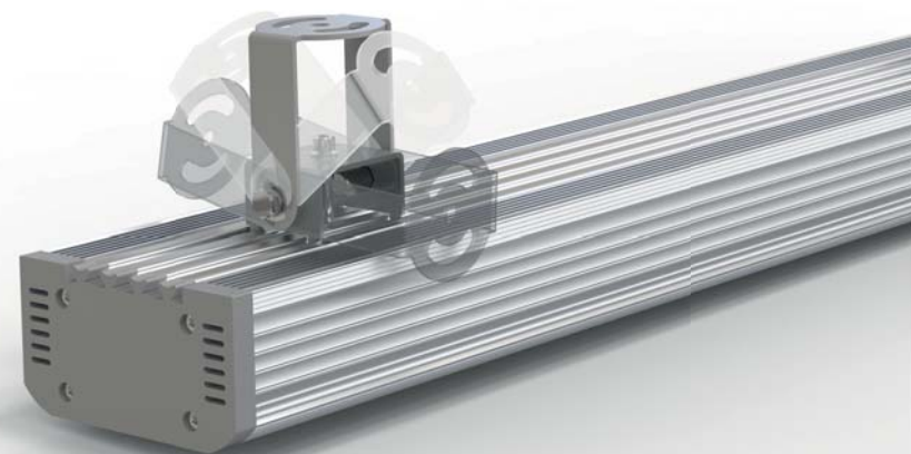
Угол поворота прожектора – 180°