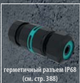
герметичный разъем IP68 (см. стр. 388)

Подвод сетевого кабеля может осуществляться к выносному герметичному (IP68) разъему (заказывается отдельно).