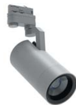
Цвет корпуса "Серый"