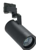
Цвет корпуса "Черный"