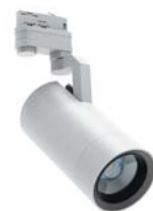
Цвет корпуса "Белый"